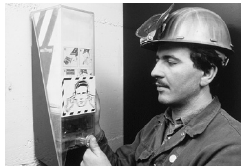
7 Distributeur de protecteurs d'ouïe: les protecteurs d'ouïe doivent être facilement disponibles à tout moment.